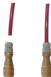
Connecteur laiton GAZ