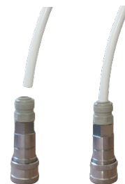
Connecteur inox LIQUIDE